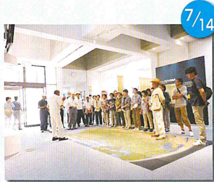
県外研修 舞鶴引揚記念館