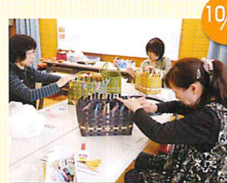
エコクラフトバッグ作り