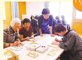
干支の額絵作り教室