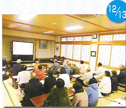
県内研修 倉吉市 やまびこ人権文化センター