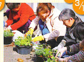
春の寄せ植え体験教室