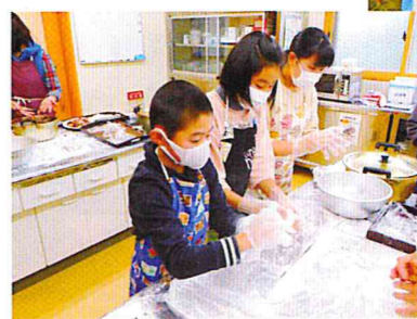
新春のつどい 餅つき

を研究し、また挑戦したいと思いを加したいと思っています。 来年度も、色々な事業に協力・参加したいと思っています。