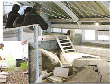
北淡震災記念公園断層