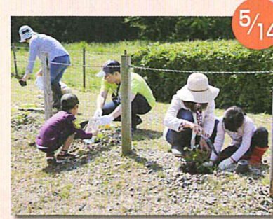
天神山城跡遊歩道に植栽