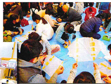
新春のつどい 凧づくり