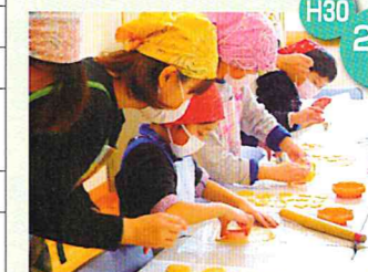
親子でお菓子作り教室