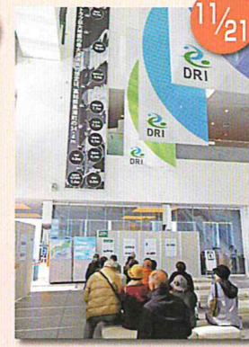
防災県外研修 人と防災未来センター