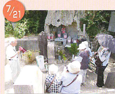
ジオパークを学ぼう！ 岩美町・岩戸地蔵尊