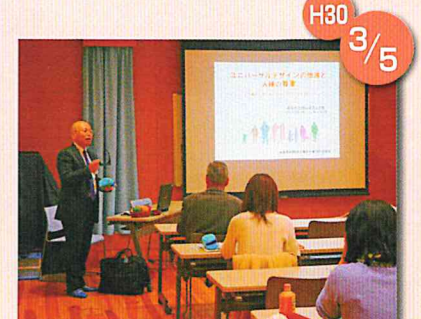
カラーユニバーサルデザインを学ぼう！