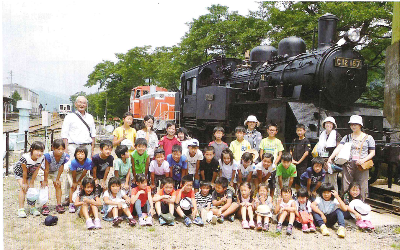
H29.7.28 若桜鉄道に乗って、わかさ氷ノ山に行こう!

平成二十九年度の諸事業は、地区の皆様の温かいご理解とご支援をいただき、無事に終えることができました。改めて感謝申し上げます。 正月にある方から年賀状を頂きました。その方は、公民館事業のパソコン教室で年賀状の作り方を学習された方で、「やっとならぬように」になって、うれしくて年賀状を出しました。というごことでした。とてもうれしくなり、「ギャラー湖山」に展示させていただきます。 また、昨年度から年末に行っている「門松づくり」はとても好評で、参加希望も多く、作品ができあがると、皆さんから「来年も是非お願いします」と、帰りながら声をかけてくださいました。さらに、これしかたのは、有志による「チーム門松」(自称)が結成され、材料の準備から、当日のお手伝い、さらに「公民館の玄関に大きな門松を飾ろう」ということに発展し、手探りながらもりっぱな門松が飾られました。こ