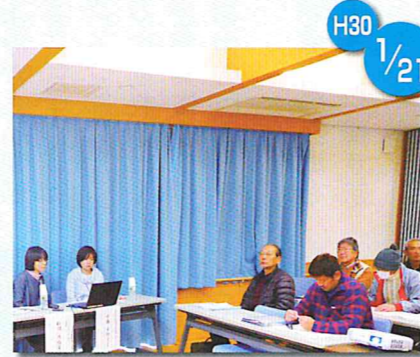
講演会 高齢者の認知症や虐待を通じて人権を考える！