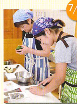
夏の薬膳料理教室