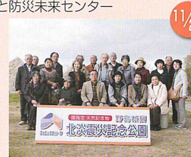
北淡震災記念公園 野島断層保存館見学